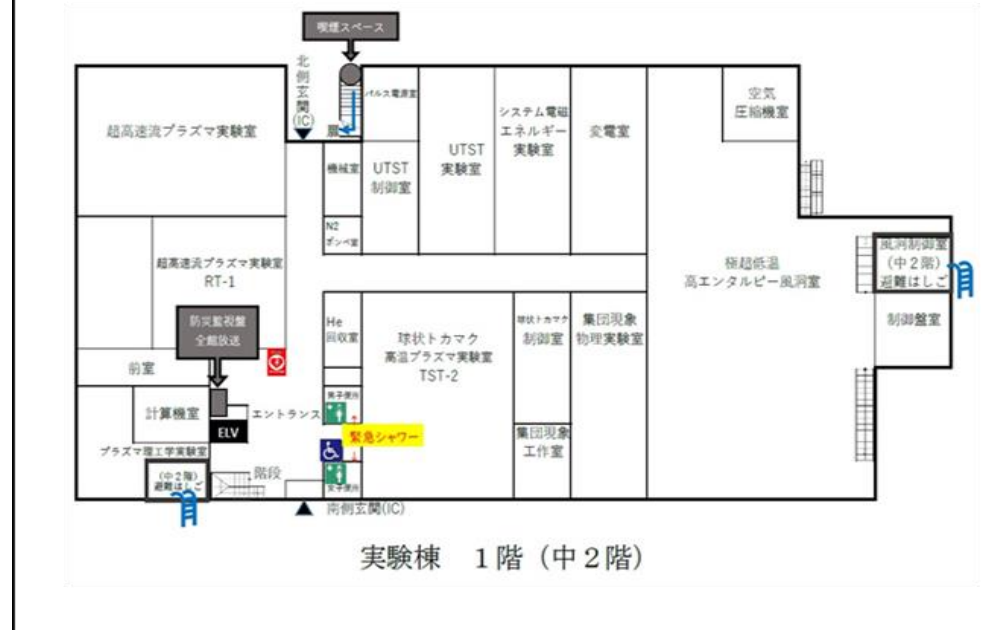
実験棟 1階 (中2階)