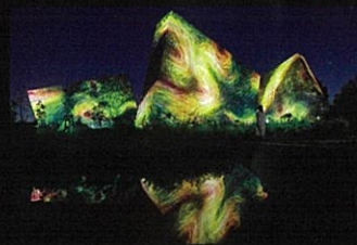
チームラボ ボタニカルガーデン 大阪