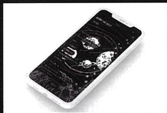
BUMP OF CHICKEN リスナー向け公式アプリ