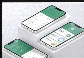
りそなグループアプリ