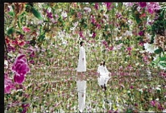
teamLab Planets TOKYO DMM