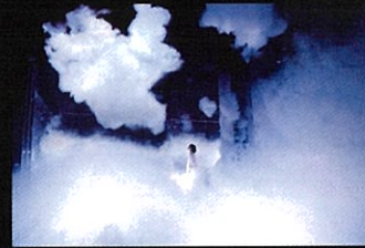
teamLab Massless Beijing