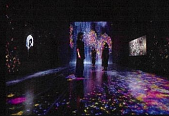
Future World: Where Art Meets Science