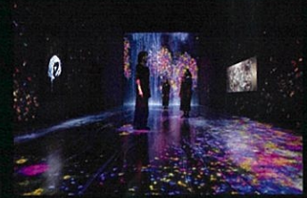
Future World: Where Art Meets Science