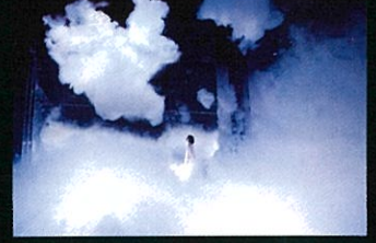
teamLab Massless Beijing