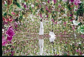
teamLab Planets TOKYO DMM