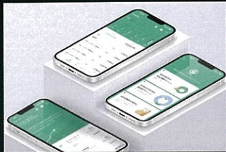
りそなグループアプリ