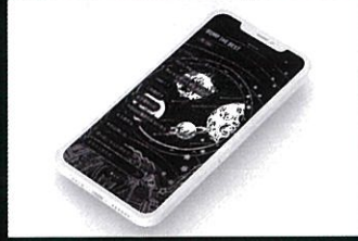
BUMP OF CHICKEN リスナー向け公式アプリ