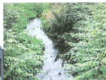
寮裏を流れる小川