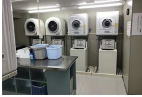
共用ランドリー室 037